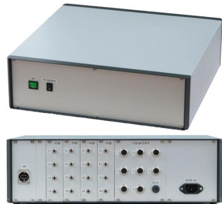
Messgeräte und elektronische Datenerfassung der mobilen Messapparatur