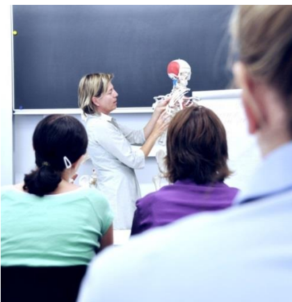
Gesucht: Alternativen zum Medizinstudium.