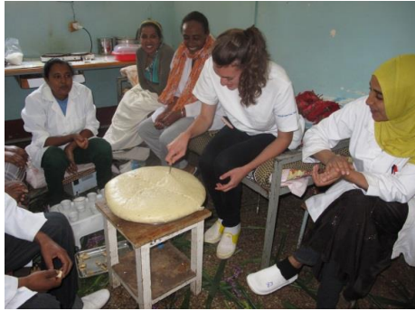
Kaffeezeremonie an meinem letzten Arbeitstag