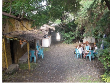
Vorplatz vor dem Gästehaus der Link Ethiopia Organisation