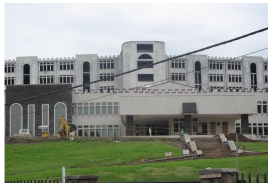
Die neue Klinik, welche im Jahr 2015 eröffnet werden soll.

Das Spital befindet sich in Gondar, im Norden Äthiopiens. Es umfasst 400 Betten (22 davon im Gebärsaal) und liegt im Einzugsgebiet für ca. 4 Millionen Menschen. Über 7'000 Kinder kommen pro Jahr in dieser Klinik zur Welt.