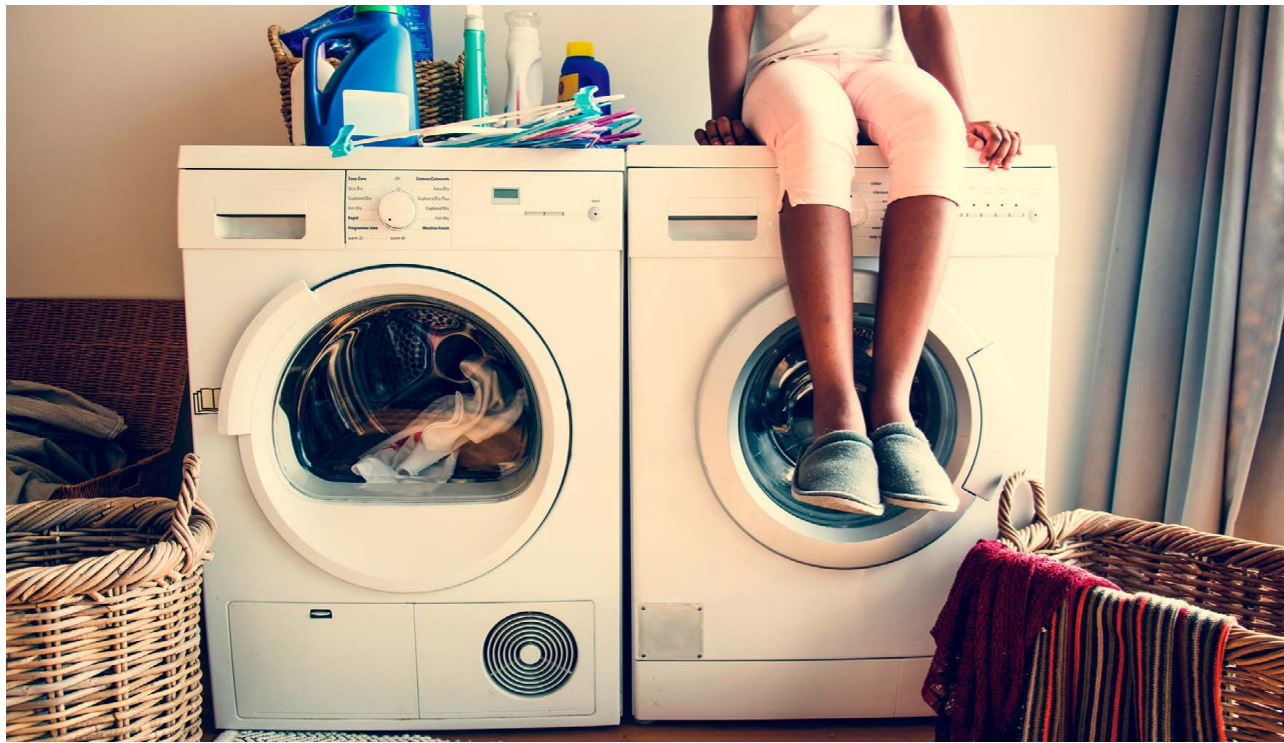
Kinder und Jugendliche, die ihre Angehörigen betreuen, sind zahlreicher, als man denkt: 2017 zeigte die erste repräsentative Studie in der Schweiz, dass rund acht Prozent der 10- bis 15-Jährigen eine Person betreuen oder pflegen – das sind knapp 40'000 Kinder und Teenager.

Mit Behörden verhandeln statt Freunde treffen. Haushalten statt spielen. Pflegen statt unbeschwert feiern. Kinder, Jugendliche und junge Erwachsene, die ein Familienmitglied betreuen und pflegen, führen oft ein Leben, das sich stark von dem Gleichaltriger unterscheidet. Sie werden Young Carers genannt und sie sind zahlreich: 2017 zeigte die erste repräsentative Studie für die Schweiz, dass rund acht Prozent der 10- bis 15-Jährigen eine Person betreuen oder pflegen – das sind knapp 40'000 Kinder und Teenager. Bei jungen Erwachsenen, sogenannten Young Adult Carers, sei der Anteil