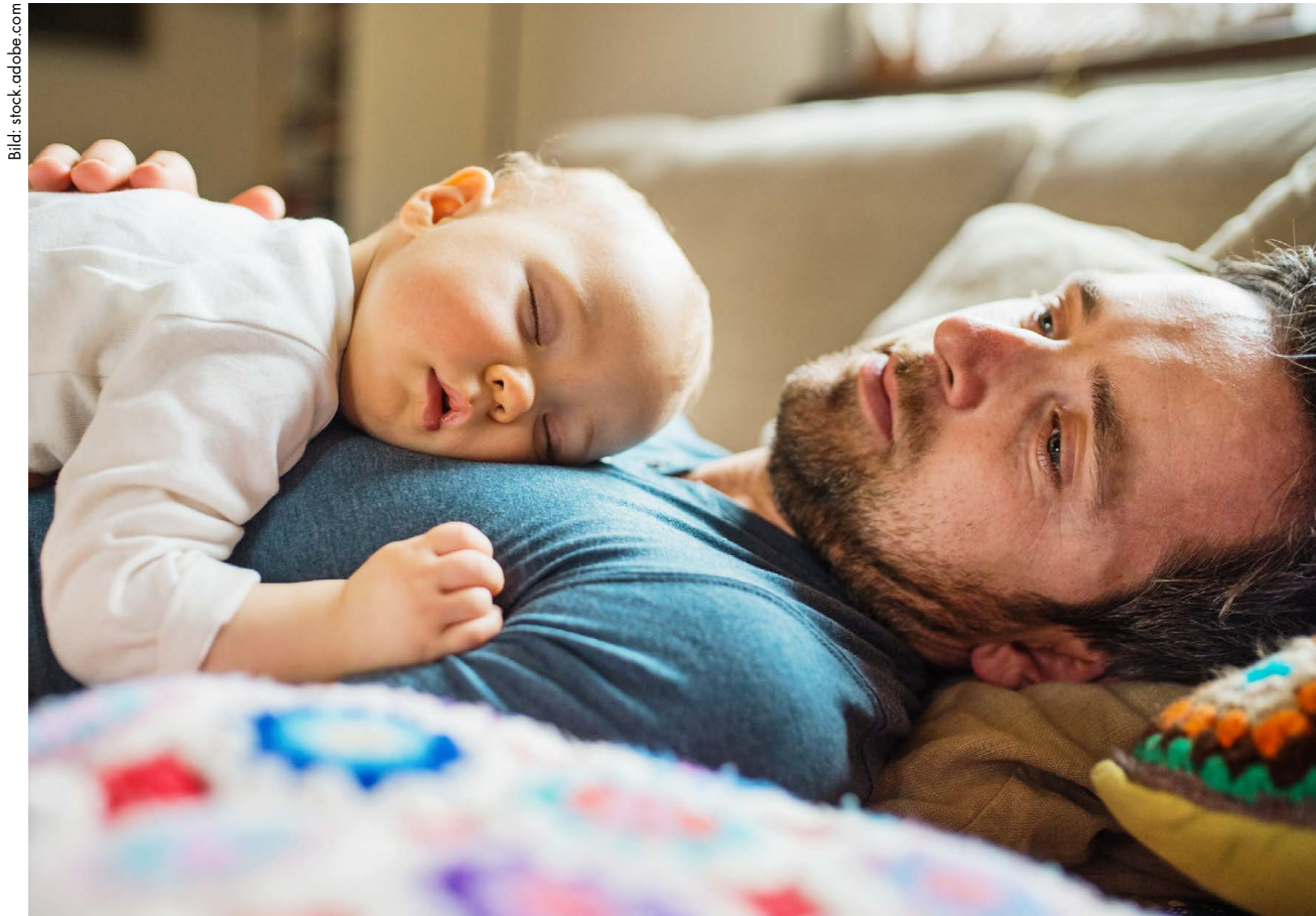
Wenn sich das Vatersein nicht nach Glück anfühlt: Postpartale Depressionen bei Männern sind eigentlich gut erforscht, das Wissen darüber ist in der Gesellschaft aber noch zu wenig verbreitet. Nach wie vor gilt: Männer dürfen keine Schwäche zeigen.