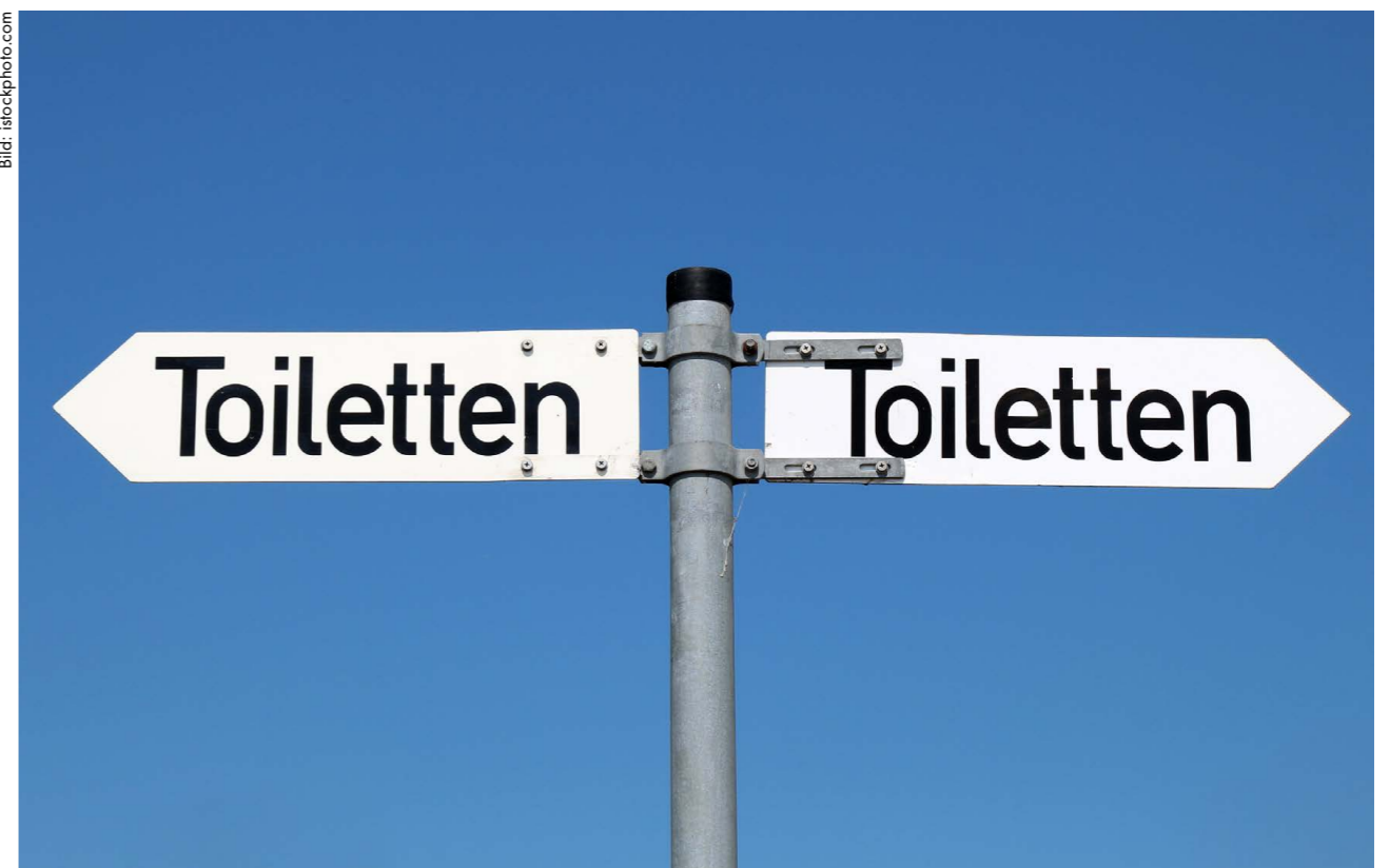
Alle Wege führen zur Toilette: Wer inkontinent ist, leidet oft sehr darunter. Umso dankbarer sind Betroffene, wenn Fachleute genau hinschauen und offen mit ihnen darüber sprechen.

K aum etwas ist uns peinlicher, als wenn wir unsere Ausscheidungen nicht kontrollieren können. Urin- und seltener auch Stuhlinkontinenz ist jedoch häufiger als gedacht. Sie kommt nicht nur bei betagten Menschen, Frauen nach der Geburt oder Männern nach einer Prostata-Operation vor, sondern auch bei jüngeren Personen. Gemäss einer in Deutschland durchgeführten Umfrage von 2005 sind gut sechs Prozent der unter 40-jährigen – Kleinkinder ausgenommen – gelegentlich betroffen. Am