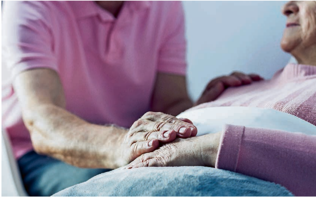
Die Begleitung ist wichtig, auch vonseiten der Angehörigen: Betagtes Paar im Altersheim.