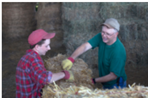
Hofalltag von Care Farmer und Pflegekind.

Der Kontext für Platzierungen von Kindern und Jugendlichen sowie Menschen mit Behinderung unterscheidet sich aufgrund der föderalen Struktur in den drei Kantonen erwartungsgemäss stark. Die Studie zeigt: Für die befragten Behördenmitglieder sind Platzierungen in die Landwirtschaft für beide