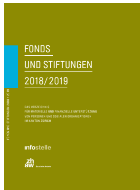
Fonds und Stiftungen 2018/2019 Das Verzeichnis für materielle und finanzielle Unterstützung von Personen und sozialen Organisationen im Kanton Zürich Infostelle (Hrsg.) 2017 CHF 35.00