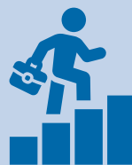
Verbesserte Chancen auf dem Arbeitsmarkt