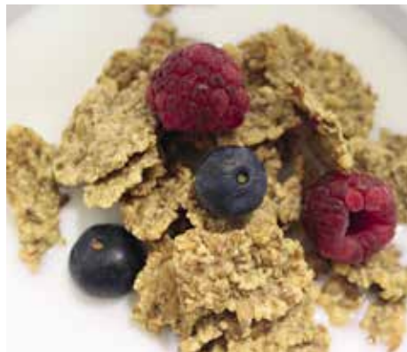
Flakes mit Früchten und Milch

Fett-, Salz- und Zuckerreduktion bei Lebensmitteln sind in den Medien omnipräsent. Verarbeitete Lebensmittel enthalten häufig zu viel davon, sind aber bei den Konsumierenden beliebt, weil sie gut schmecken. In dem vom Bundesamt für Lebensmittelsicherheit und Veterinärwesen (BLV) in Auftrag gegebenen Forschungsprojekt «Zuckerreduktion in Frühstückscerealien: Technologische Machbarkeit und sensorische Wahrnehmung» untersucht die Forschungsgruppe Lebensmittel-Sensorik gemeinsam mit Industriepartnern Möglichkeiten, den Zucker in verschiedenen Arten von Frühstückscerealien zu reduzieren, ohne dass dies zu einer Einbusse an Süßwahrnehmung führt. Die Konsumentinnen und Konsumenten sollen die Produkte «gleich süß» wahrnehmen, verglichen mit solchen ohne Zuckerreduktion. Dafür wurden in drei Kategorien von Frühstückscerealien (Knuspermüesli, Flakes und Puffs/Pops) mit unterschiedlichen rezepturbasierten und/oder technologischen Strategien zuckerreduzierte Varianten hergestellt und in Konsumententests sensorischen Prüfungen unterzogen. Die Ergebnisse