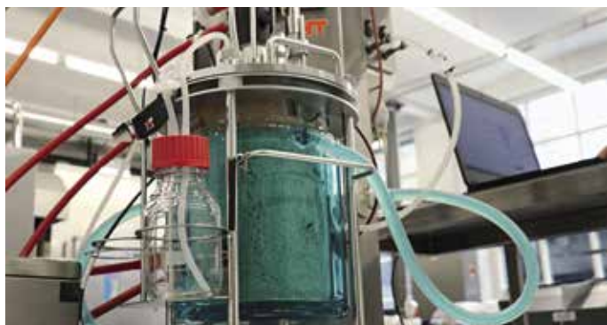
Abb. 1: Fermentation von Weizenkleie im Feststofffermenter zur Verifizierung des minimal notwendigen Wassergehaltes, der eine Stoffwechselaktivität von fermentationsrelevanten Mikroorganismen erlaubt.

Der Leitsatz «Wasser bedeutet Leben» gilt auch für Mikroorganismen und ist ein zentraler Faktor bei Fermentationsprozessen. Im Zusammenhang mit der Weiterverarbeitung von Pflanzennebenproduktströmen wie beispielsweise Weizenkleie, Gerstenschleifmehl oder Hülsenfruchtschalen zu Lebensmitteln bergen Fermentationen ein grosses Potential.