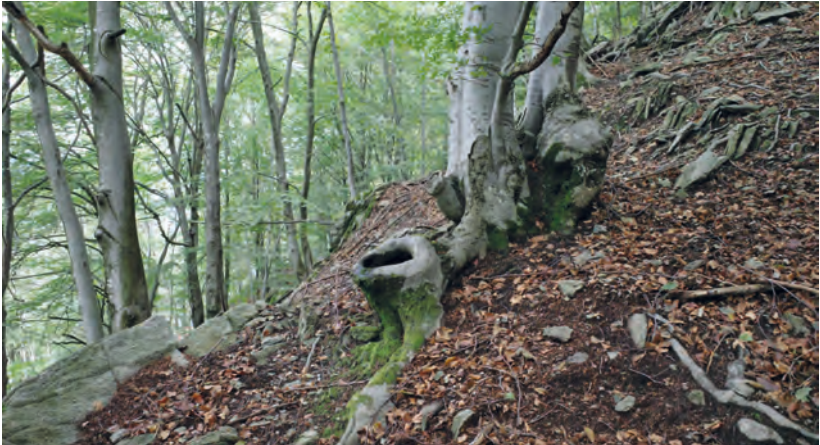
Abb. 1. Buchenwald und Dendrotelme mit Anacamptodon splachnoides im Centovalli.

Bedingungen am Standort, sodass man annehmen muss, dass A. splachnoides nur für eine bestimmte Zeit an diesem Ort zu finden ist, wie das auch bei der bisher bekannten Population der Fall war. Dass die Art an einer neuen Stelle gefunden wurde, lässt allerdings hoffen, dass es im Tessin noch weitere Vorkommen der Art gibt. Ob aber genügend Individuen und genügend Standorte vorhanden sind, damit sich die Population im Tessin langfristig halten kann, ist ungewiss.