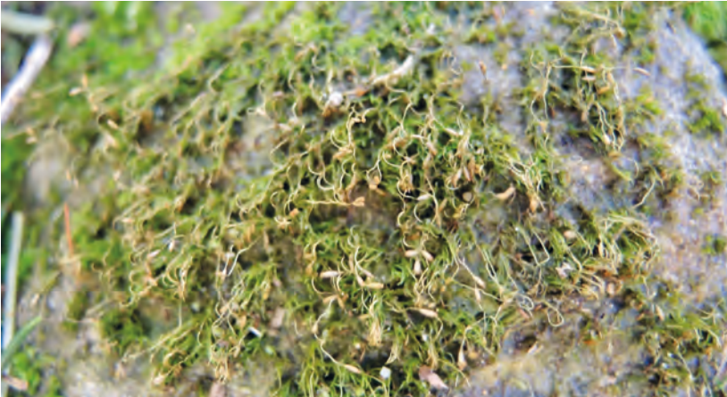
Abb. 2. Campylostelium saxicola mit den typisch verbogenen Seten.

2019 in der Nähe von Lausanne von mehreren Personen abgesucht, doch konnte die Art dort nicht wiedergefunden werden. Die übrigen alten Funde im westlichen Teil der Schweiz wurden aber offenbar nie nachgesucht. Hingegen ist ein neuerer Fund von 2017 aus dem französischen Elsass bekannt (Bailly et al. 2018).