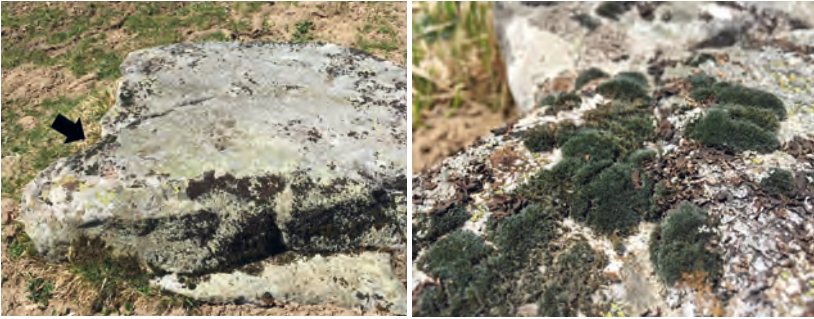
Abb. 3. Links: Der ca. 0.5 m hohe und 1.5 m lange Granit-Findling mit Grimmia montana . Der Pfeil bezeichnet die genaue Wuchsstelle, wo G. montana als dunkler Fleck sichtbar ist. Die anderen dunklen Flecken sind hauptsächlich die Flechte cf. Umbilicaria deusta . Rechts: Die Polster von G. montana auf dem Findling.

Gattungen, Parmelia s.l. spp., Rhizocarpon spp., Umbilicaria spp. und Lasallia pustulata zu erkennen und in Sachen Gefässpflanzen beherbergt der Findlingsschwarm bei „La Pidouse“ den im Jura vom Aussterben bedrohten Nordische Streifenfarn ( Asplenium septentrionale ; Mazonauer et al. 2014). Die Publikation solch spannender Fundorte, birgt die Gefahr, dass diese übermässig besucht und im schlimmsten Fall geschädigt werden. Empfehlenswert ist jedoch, selbst auf Entdeckungsreise zu gehen und bisher floristisch noch nicht dokumentierte Findlingsschwärme aufzusuchen. Um Findlinge ausfindig zu machen ist die Webseite www.map.geo.admin.ch eine grosse Hilfe. Dort sind Findlinge im Datensatz GeoCover als rote Kreuze (+) verzeichnet.