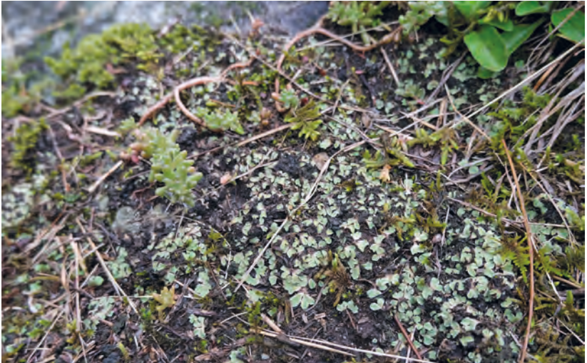
Abb. 5. Riccia ciliifera aggr. in einem lückigen Trockenrasen im südlichen Val Poschiavo.