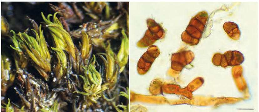
Abb. 4. Die Blätter von Racomitrium nivale bilden keine Glashaare (links) aus und in den Blattachseln werden an Zellfäden mehrzellige Brutkörper gebildet (rechts, Messbalken: 40 µm).

Am Pizzo Campo Tencia wuchs R. nivale zusammen mit Grimmia triformis Carestia & De Not., die dort oberhalb von 2900 m ü.M. sehr häufig ist. Das Gebiet ist bryologisch allgemein sehr interessant. So fand ich am Pizzo Campolongo-Pizzo Campo Tencia-Massiv noch weitere Besonderheiten wie Gymnomitrium obtusum Lindb., Andreaea heinemannii Hampe & Müll.Hal., Hygrohypnum molle (Hedw.) Loeske und Arctoa fulvella (Dicks.) Bruch & Schimp. Am Standort bei der Trifthütte war – ähnlich wie am Campo Tencia – wegen der rauen Bedingungen nur eine spärliche und artenarme Moosvegetation ausgebildet. In der näheren Umgebung des Fundorts wuchsen dort Andreaea rupestris Hedw., Hygrohypnum molle und Kiaeria falcata var. pumila (Saut.) Podp. Am Standort bei der Trifthütte war – ähnlich wie