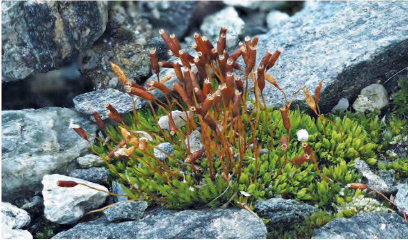
Abb. 7. Tortula leucostoma im Egginerjoch mit den typischen weissen Peristomzähnen.