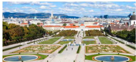
Die Donaumetropole Wien